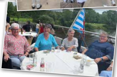
"Eppelpress" - Eppeldorf